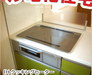
IHクッキングヒーター