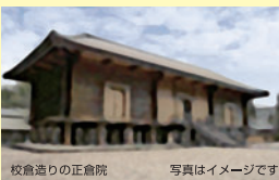
校倉造りの正倉院 写真はイメージです

“板倉の家”とは正倉院(国宝)に代表される日本古来の伝統工法である校倉造りを原型として現代の住宅にとり入れたものです。“板倉”の代表的な建物としては伊勢神宮が有名です。 → 詳しくは裏面へ